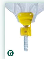
Schwenkhahn gedreht für Linksträger