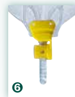
Schwenkhahn gedreht für Linksträger